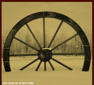
EXPO CHEMIN MILLAR DRIVE EXHIBIT

The Dawson Trail Commemorative Project features 15 new wayfinding markers and a series of permanent art exhibits highlighting the traditional place names and the historic legacy of the first all-Canadian access road linking the east with the prairies of the west. This project is inter-regional in scope and complements the research, annual art tour and tourism itineraries promoted on our website at www.dawsontrailtreasures.ca .