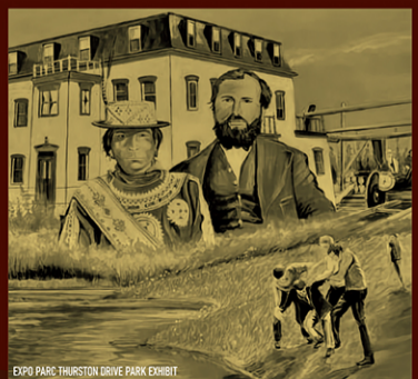
EXPO PARC HURON/STON DRIVE PARK EXHIBIT