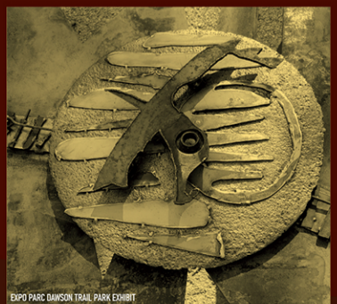
EXPO PARC DAWSON TRAIL PARK EXHIBIT