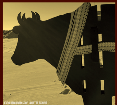
EXPO RIVER COOP LORETTE EXHIBIT